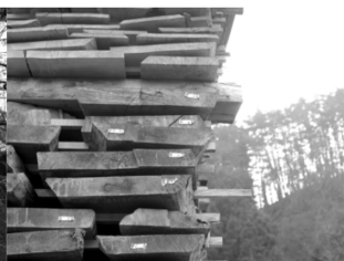
時間をかけた天然乾燥