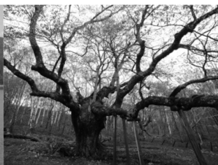
早坂高原のシナノキ