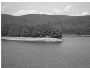
風光明媚な岩洞湖